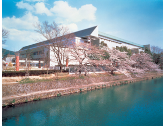
第49回近畿医学検査学会会場「みやこめっせ」

第49回近畿医学検査学会を今年の11月28日（土）、29日（日）の両日に、京都市勧業会館「みやこめっせ」において京臨技が担当県として開催いたします。学会の成功に向けて全力を注ぐ所存ですので、会員皆様のご協力をよろしくお願いいたします。